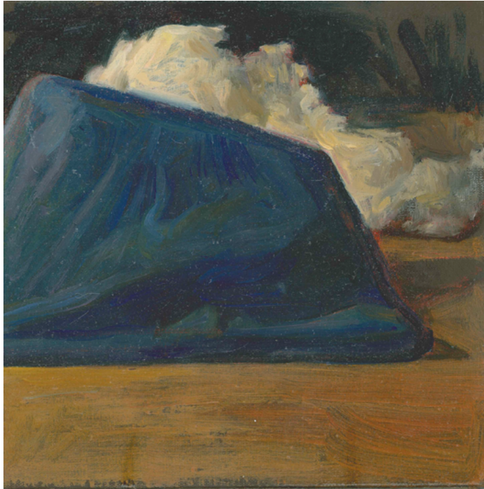
MONT BLEU ET NUAGE Huile sur toile, 25x25cm, 2018 1 000 euros