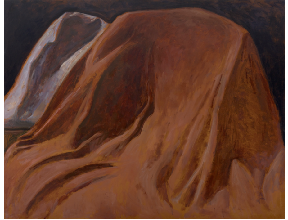
MONTAGNE NUIT Huile sur toile, 114x146cm, 2017 5 000 euros