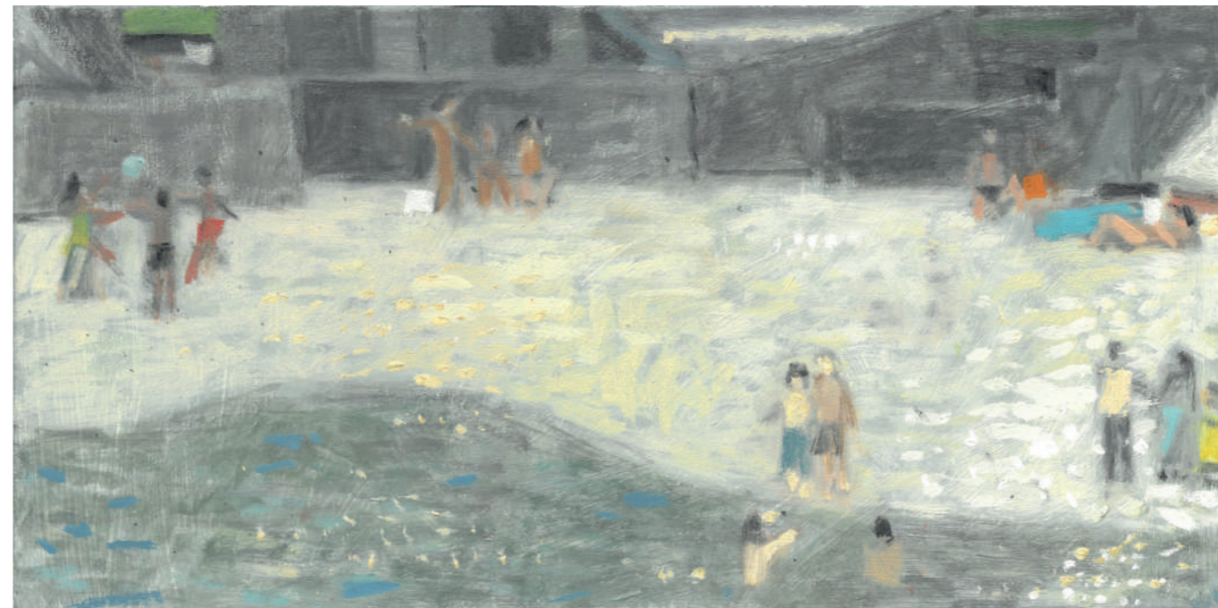
Port-en-Bessin II Huile sur toile, 20 x 40 cm, 2018.