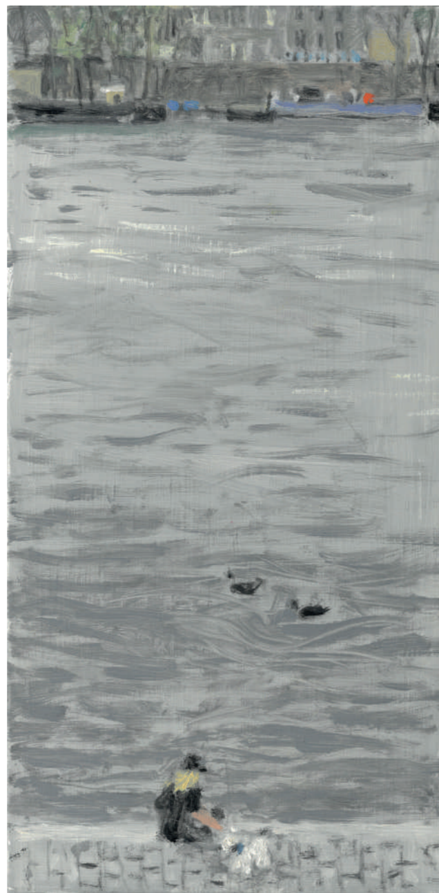
La Seine II Huile sur toile, 40 x 20 cm, 2022.