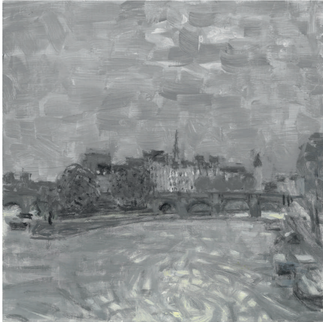
Tourbillon Huile sur toile, 25 x 25 cm, 2022.