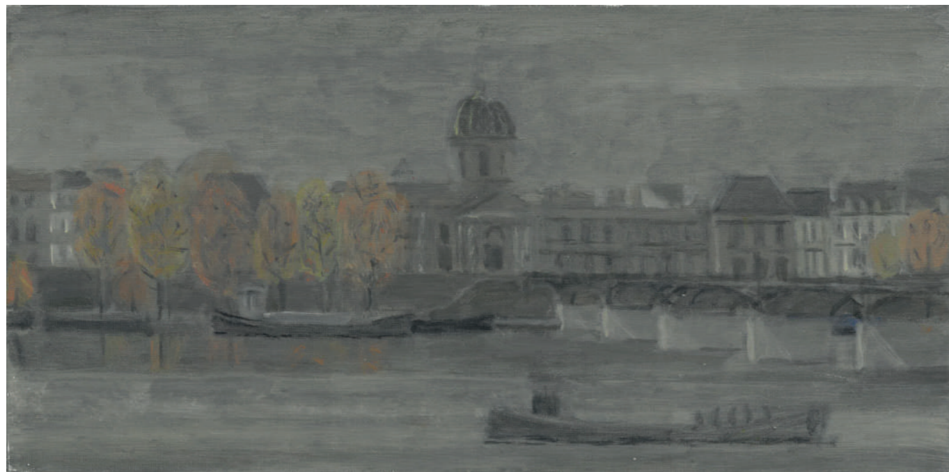
La Seine (automne) Huile sur toile, 20 x 40 cm, 2017.