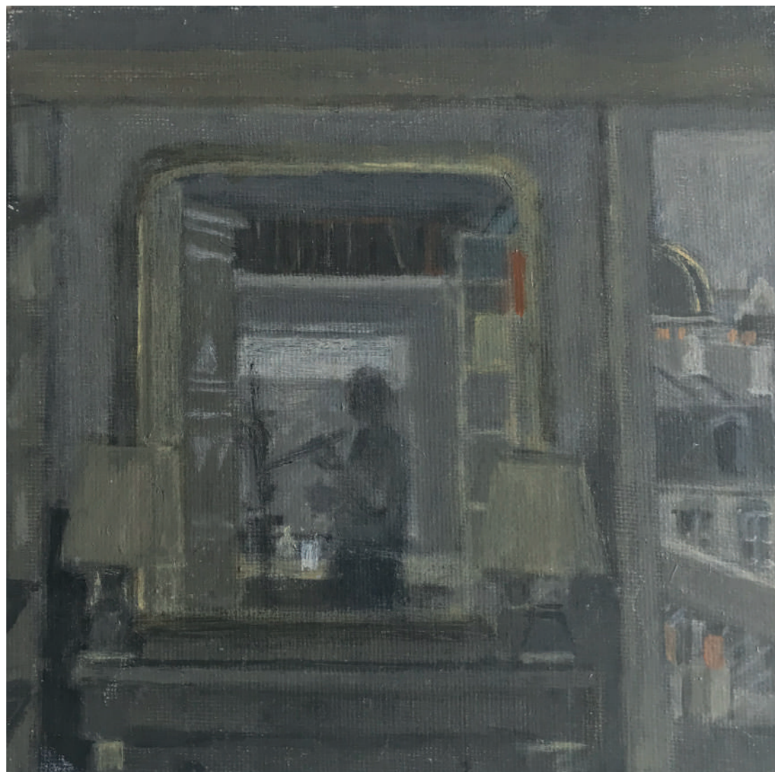
Autoportrait Huile sur toile, 20 x 20 cm, 2002.