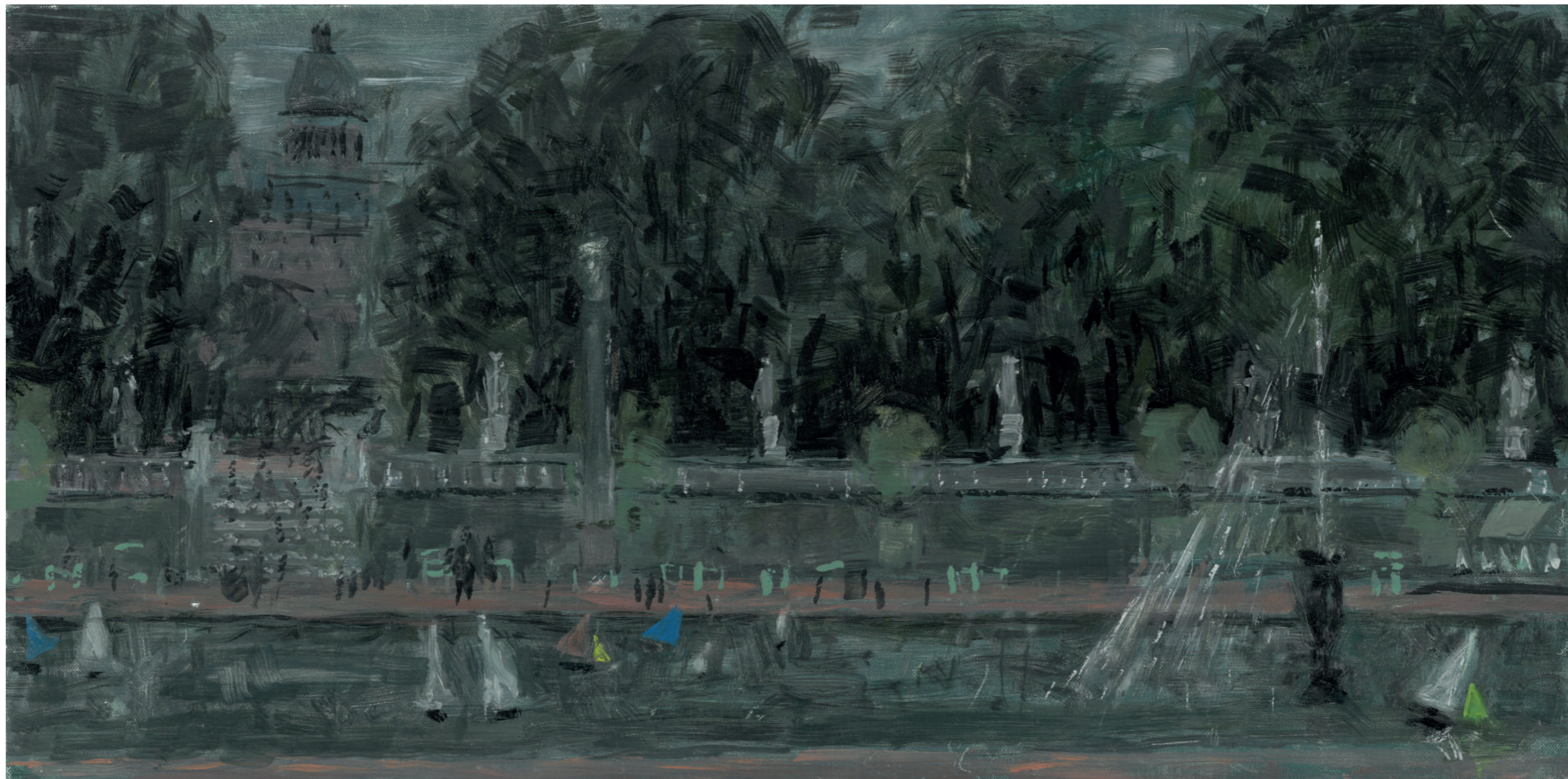
Le Bassin du Luxembourg (été) I Huile sur toile, 25 x 50 cm, 2022.