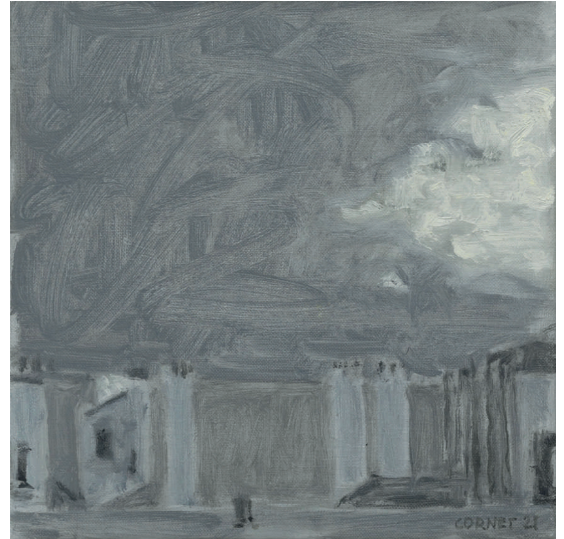
Ciel Huile sur toile, 20 x 20 cm, 2021.