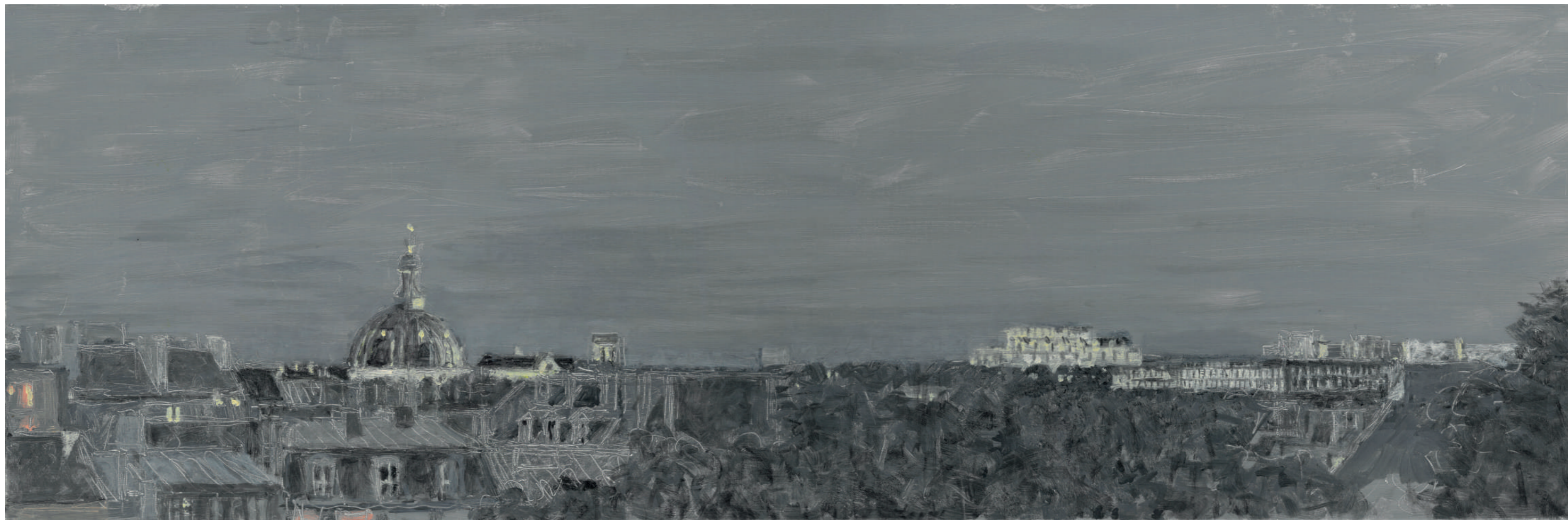
La nuit à Paris Huile sur toile, 30 x 90 cm, 2022.