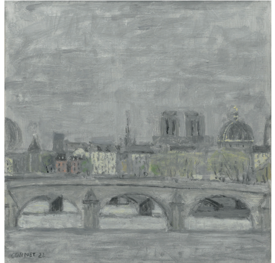
Le Pont Royal I Huile sur toile, 25 x 25 cm, 2023.