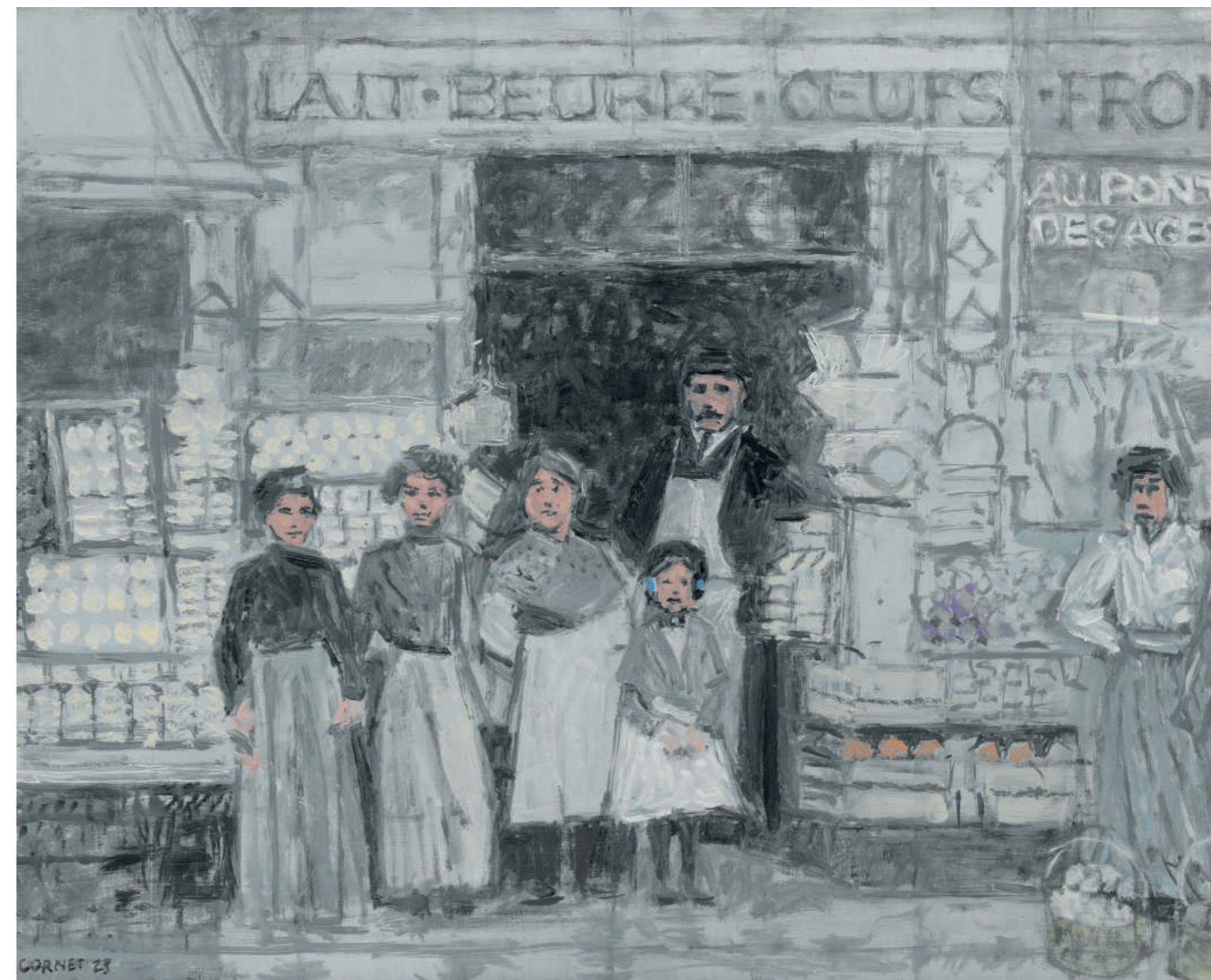
Crèmerie (1910) Huile sur toile, 40 x 50 cm, 2022.