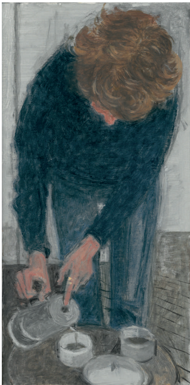
Chiara (la cafetière italienne) Huile sur toile, 40 x 20 cm, 2023.