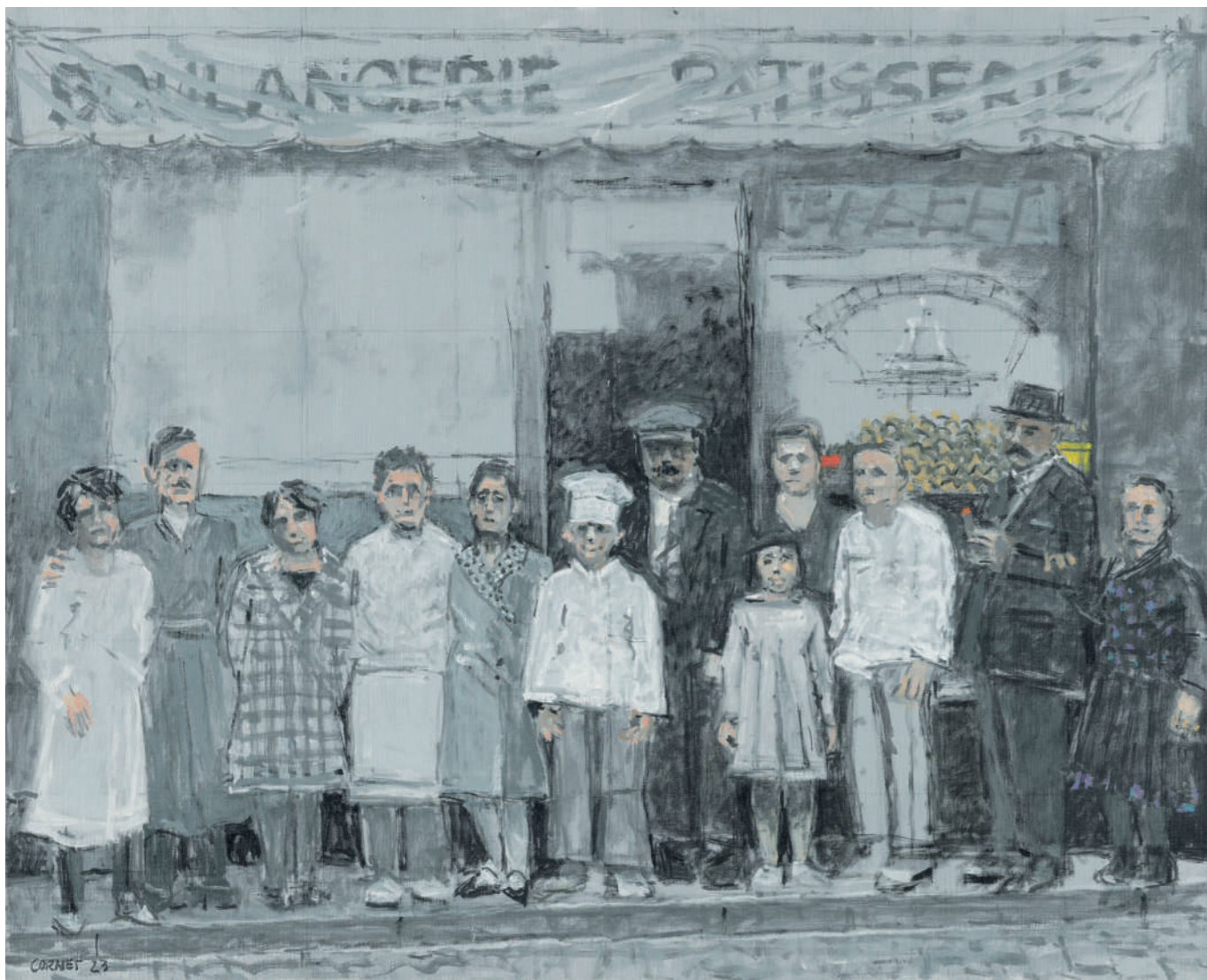
Boulangerie rue Mouffetard (1890) Huile sur toile, 40 x 50 cm, 2022.