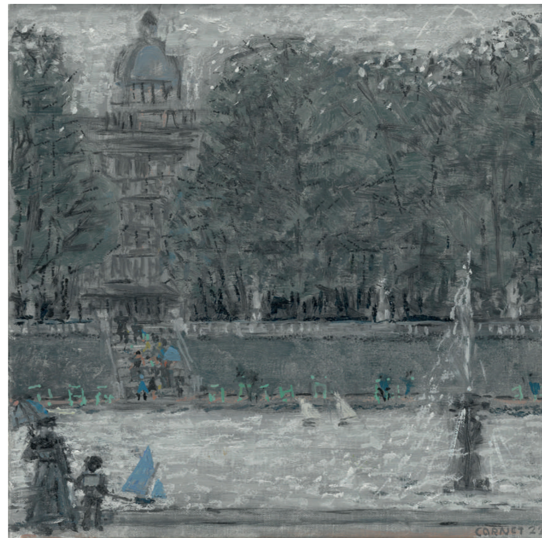
Le Bassin du Luxembourg (temps gris) Huile sur toile, 25 x 25 cm, 2022.