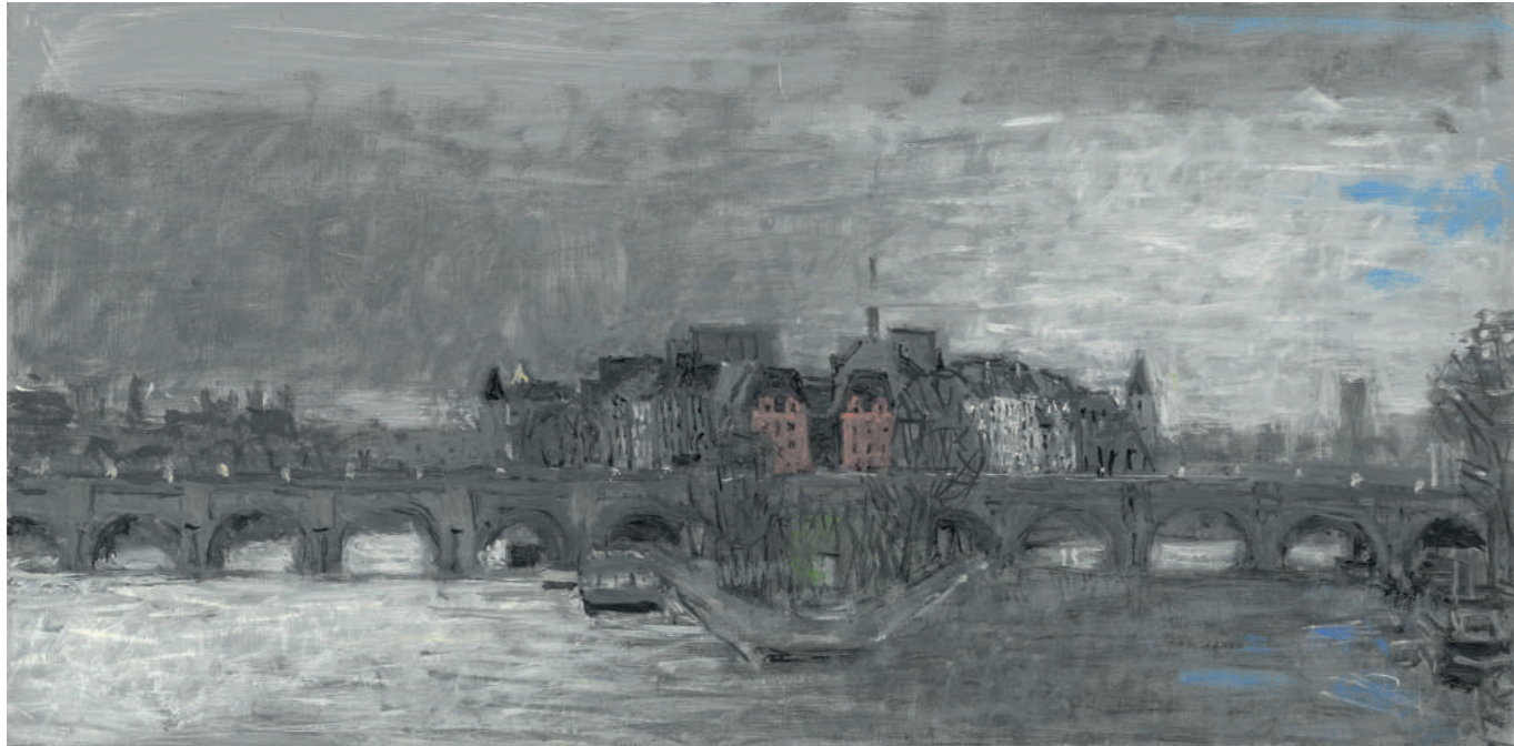
Le Vert-Galant II Huile sur toile, 20 x 40 cm, 2023.