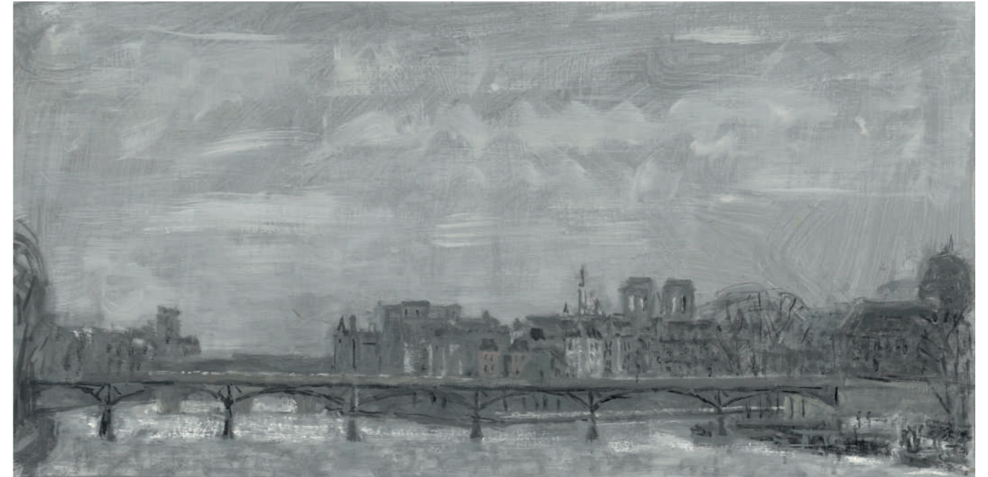
Seine grise Huile sur toile, 25 x 50 cm, 2023.