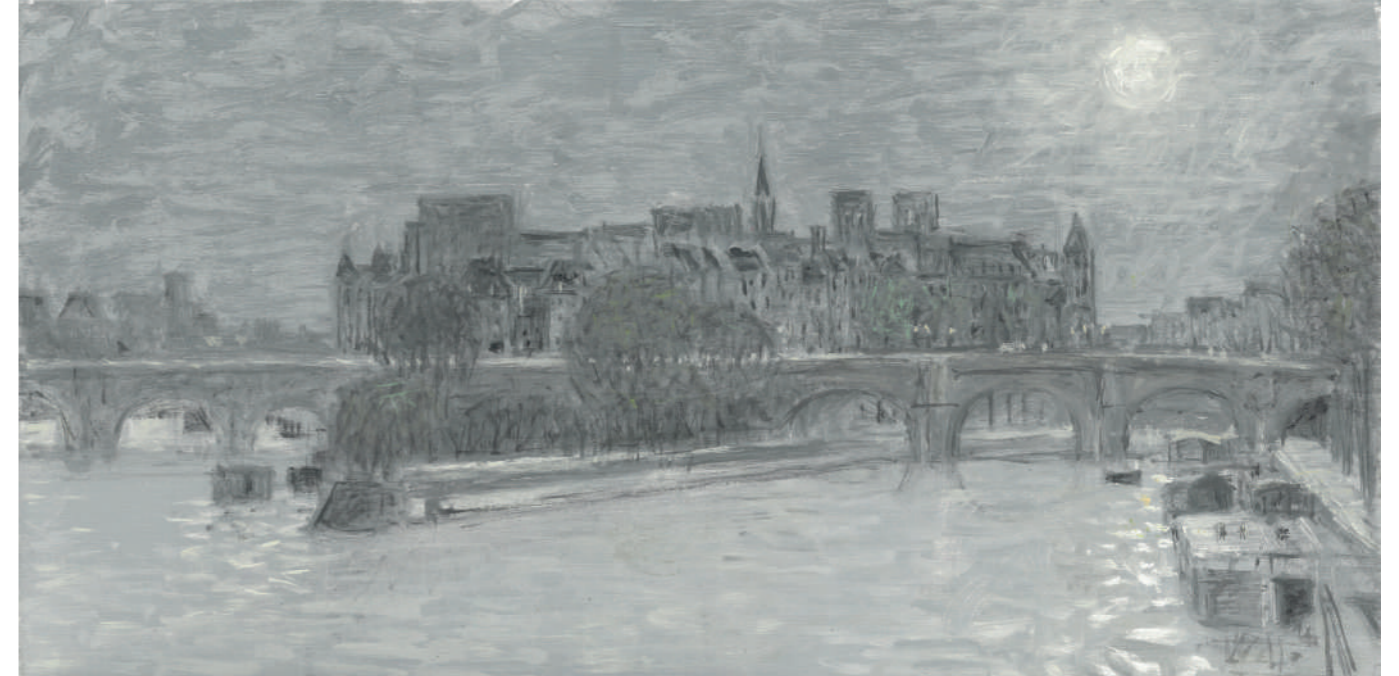
L'Île de la Cité (lumière du matin) Huile sur toile, 25 x 50 cm, 2023.