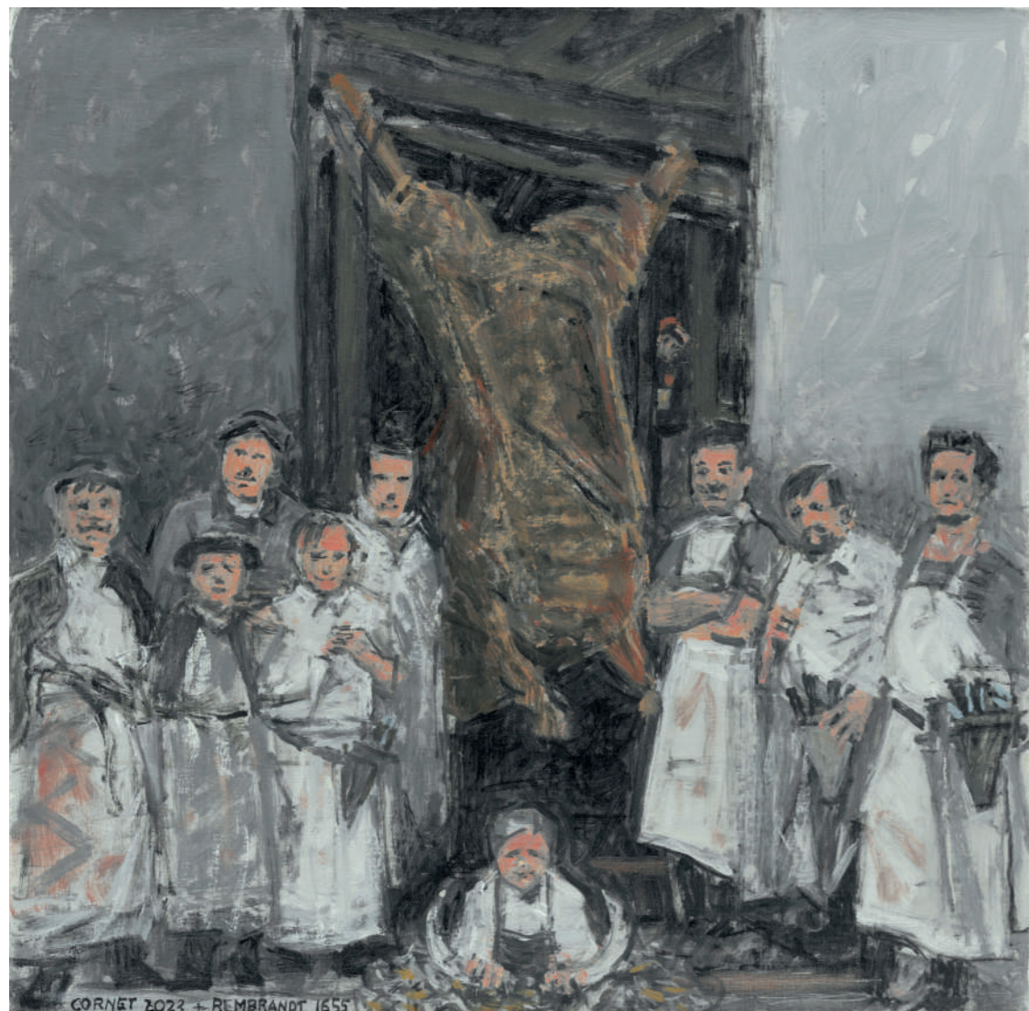
Abattoirs de Vaugirard (1905) Huile sur toile, 40 x 40 cm, 2022.