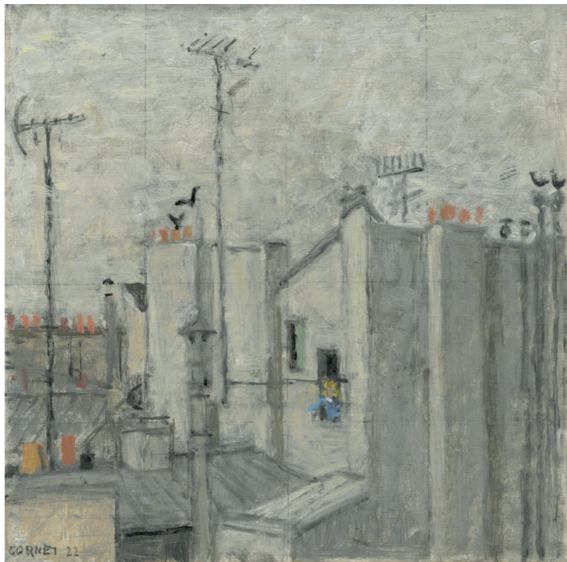
La dame des toits (antennes) Huile sur toile, 25 x 25 cm, 2022.