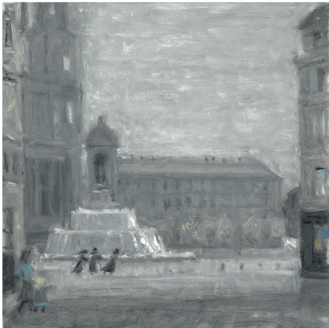
Place Saint-Sulpice I Huile sur toile, 25 x 25 cm, 2022.