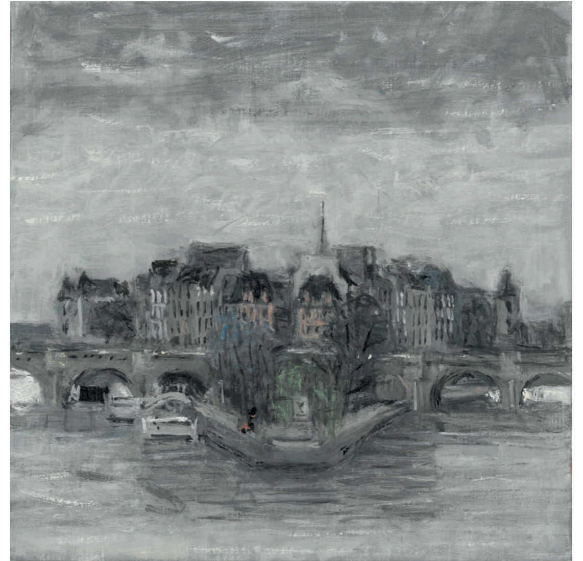
Le Vert-Galant I Huile sur toile, 20 x 20 cm, 2023.