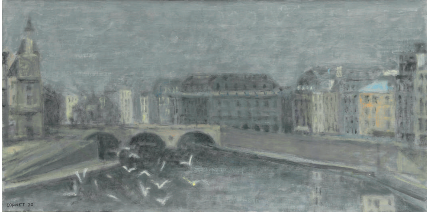
Mouettes Huile sur toile, 25 x 50 cm, 2021.