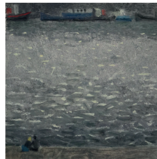
Lumière sur la Seine Huile sur toile, 25 x 25 cm, 2020.

Guillaume Apollinaire, Alcools , 1913 (extrait).