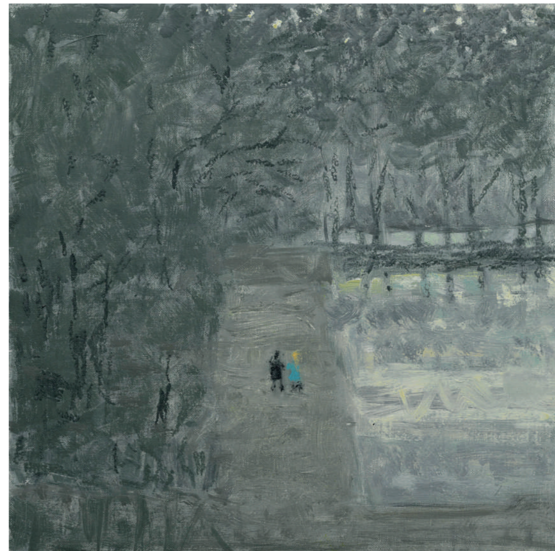
Souvenir des étangs de Ville-d'Avray Huile sur toile, 20 x 20 cm, 2022.