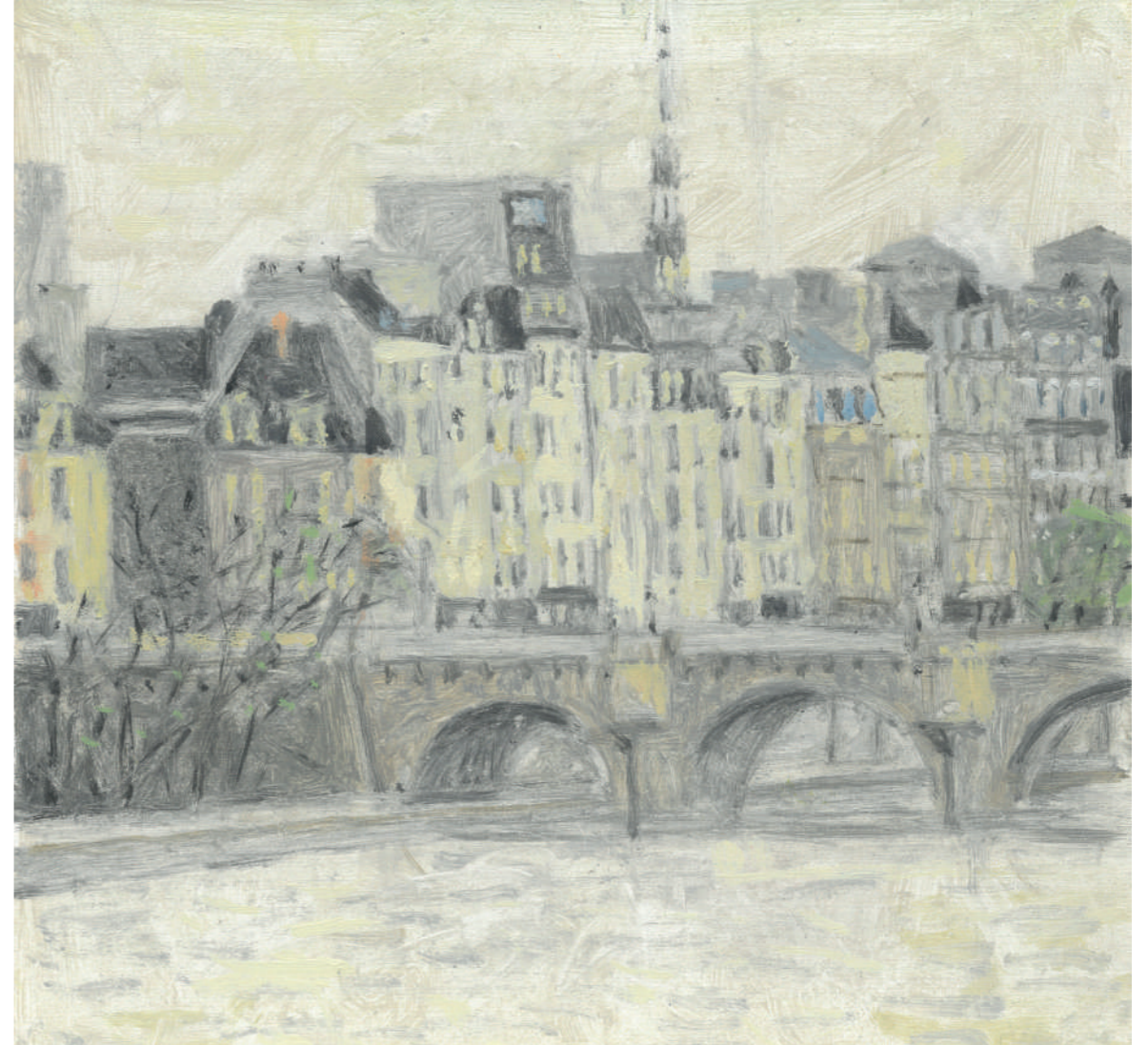
Pont-Neuf II Huile sur toile, 30 x 30 cm, 2023.