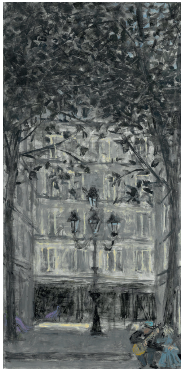
Place de Furstemberg