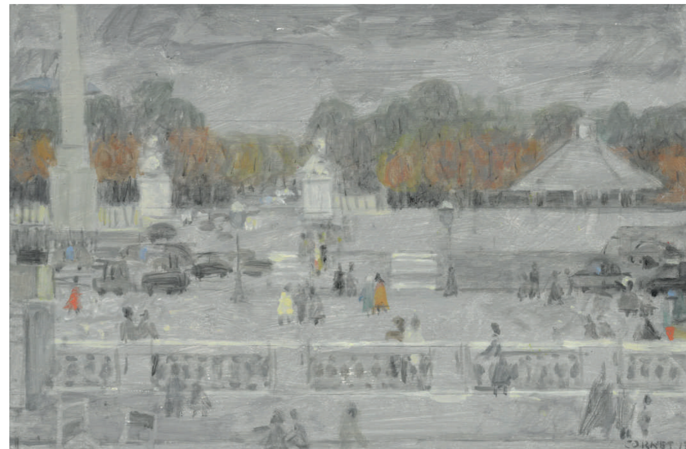
Place de la Concorde Huile sur toile, 27 x 41 cm, 2017.