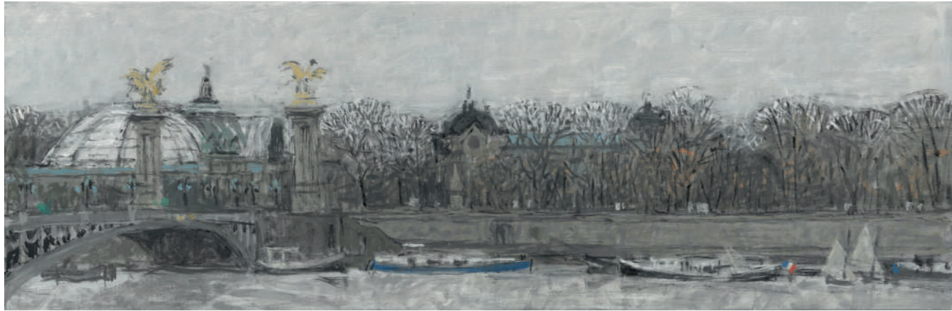
Grand Palais I Huile sur toile, 20 x 60 cm, 2023.