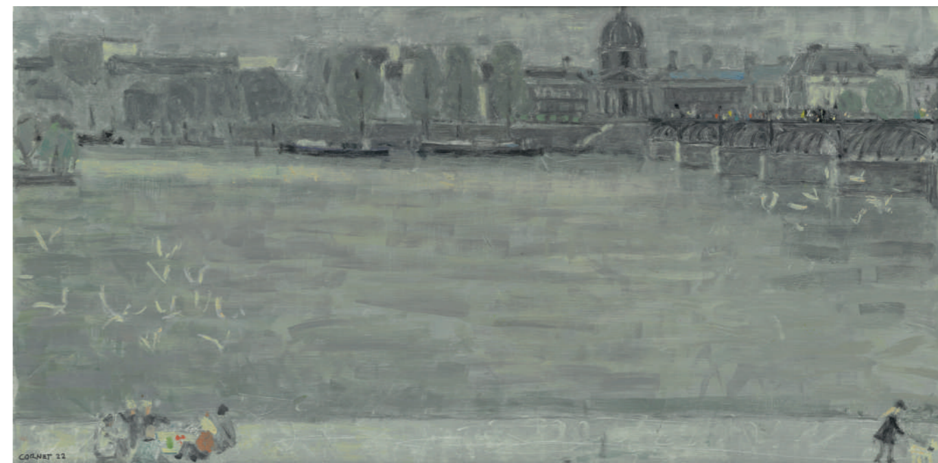
Seine verte Huile sur toile, 30 x 60 cm, 2023.