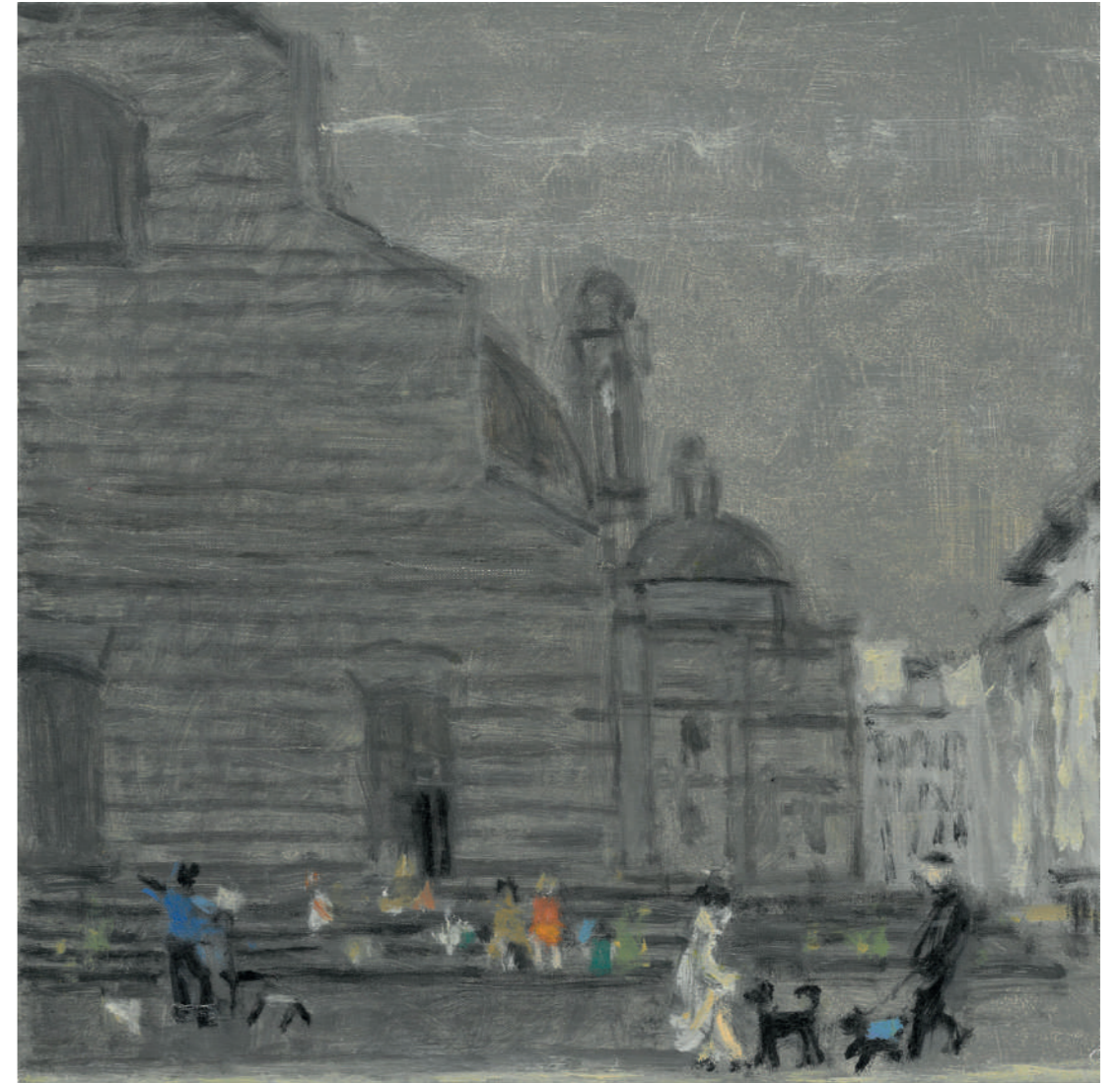
Florence, rencontre à San Lorenzo Huile sur toile, 25 x 25 cm, 2022.