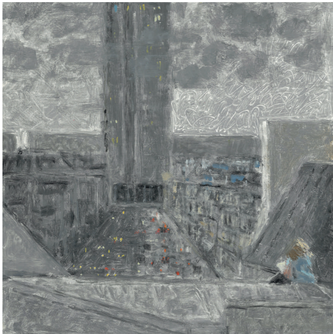
La dame des toits II Huile sur toile, 30 x 30 cm, 2022.