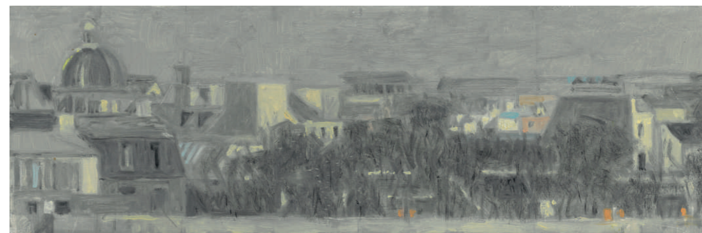
Cœur d'îlot rue Jacob Huile sur toile, 20 x 60 cm, 2021.