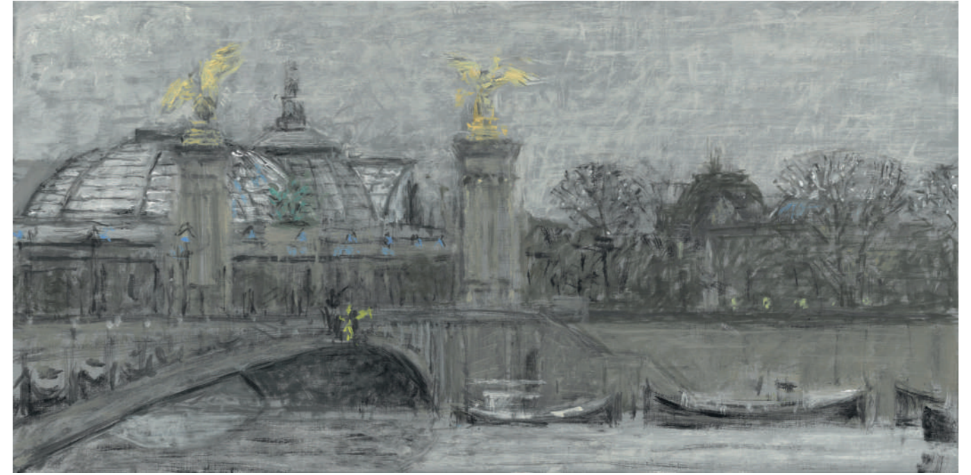
Grand Palais II Huile sur toile, 25 x 50 cm, 2023.