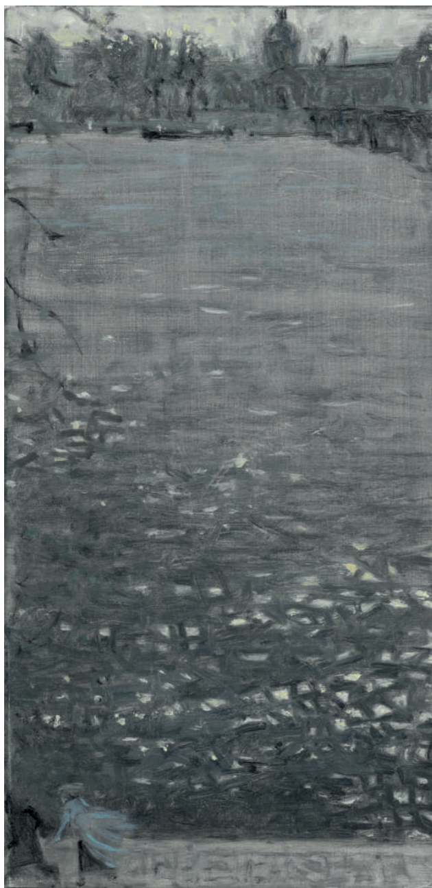
La Seine I Huile sur toile, 40 x 20 cm, 2022.