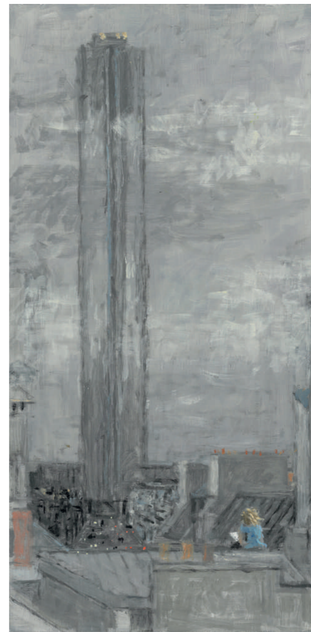
La dame des toits III Huile sur toile, 50 x 25 cm, 2022.