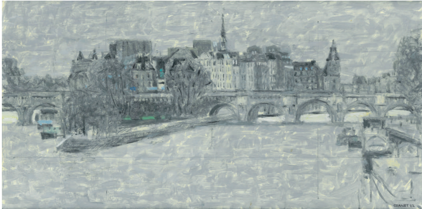
L'Île de la Cité (lumière d'argent) Huile sur toile, 30 x 60 cm, 2022.