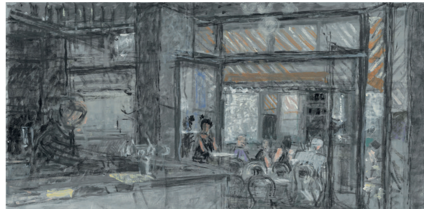
Bar du Marché (Buci) Huile sur toile, 30 x 60 cm, 2023.