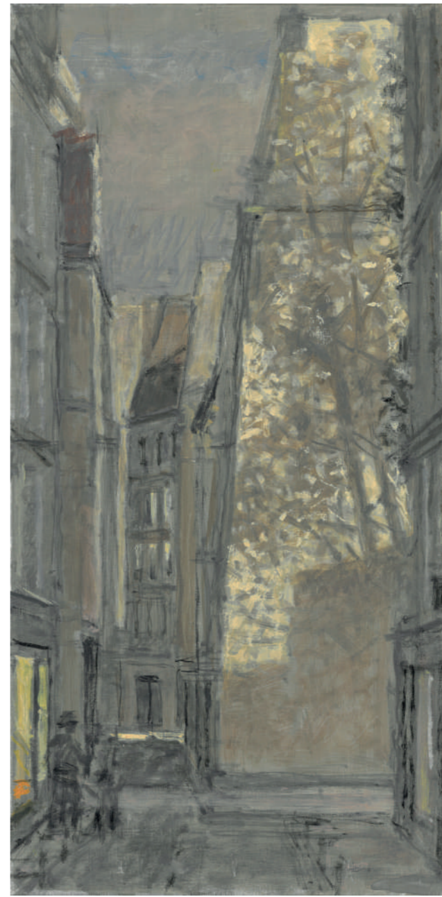
Rue de l'Échaudé, vers rue de Seine Huile sur toile, 40 x 20 cm, 2022.