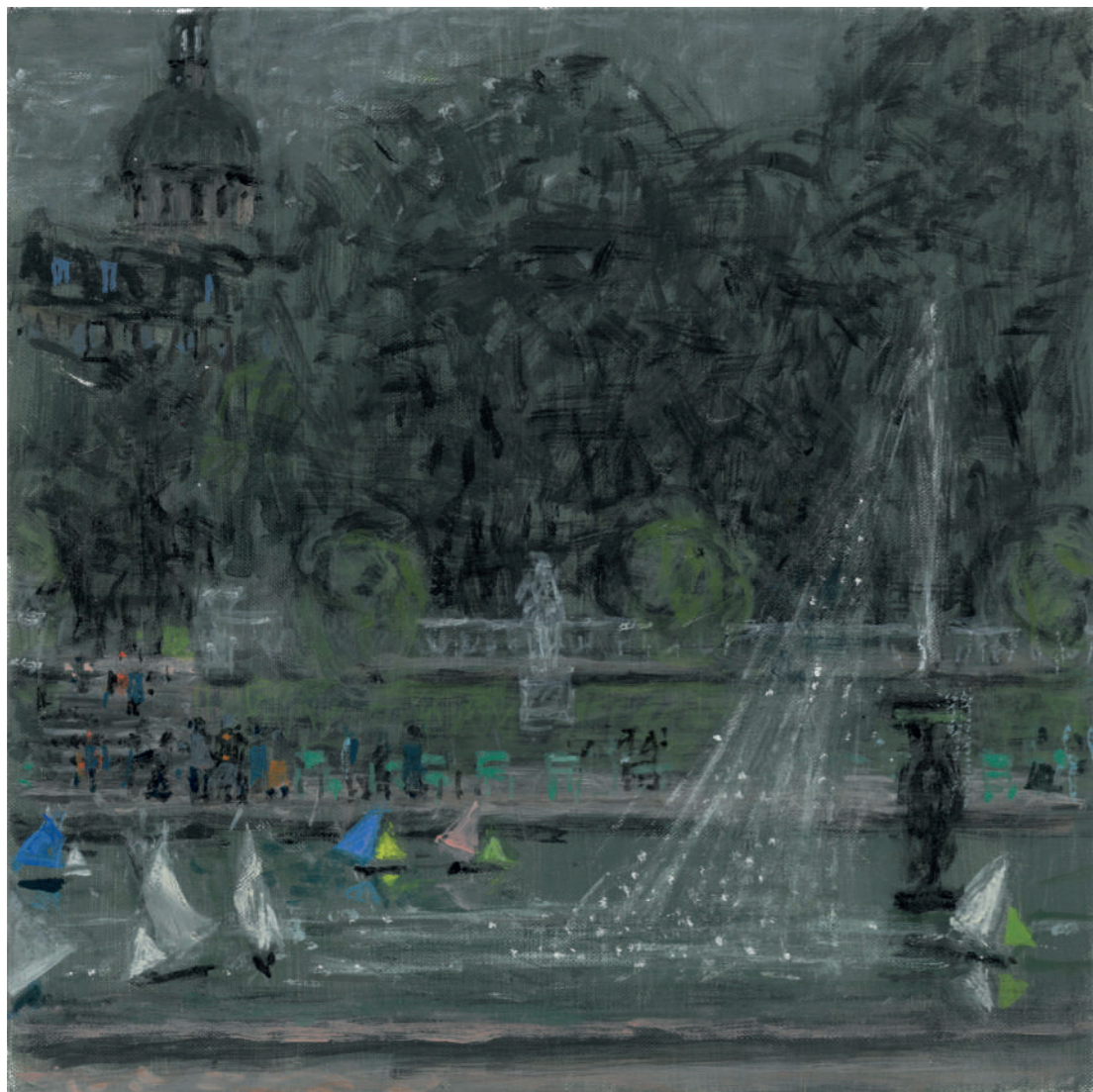
Le Bassin du Luxembourg (été) II Huile sur toile, 25 x 25 cm, 2022.