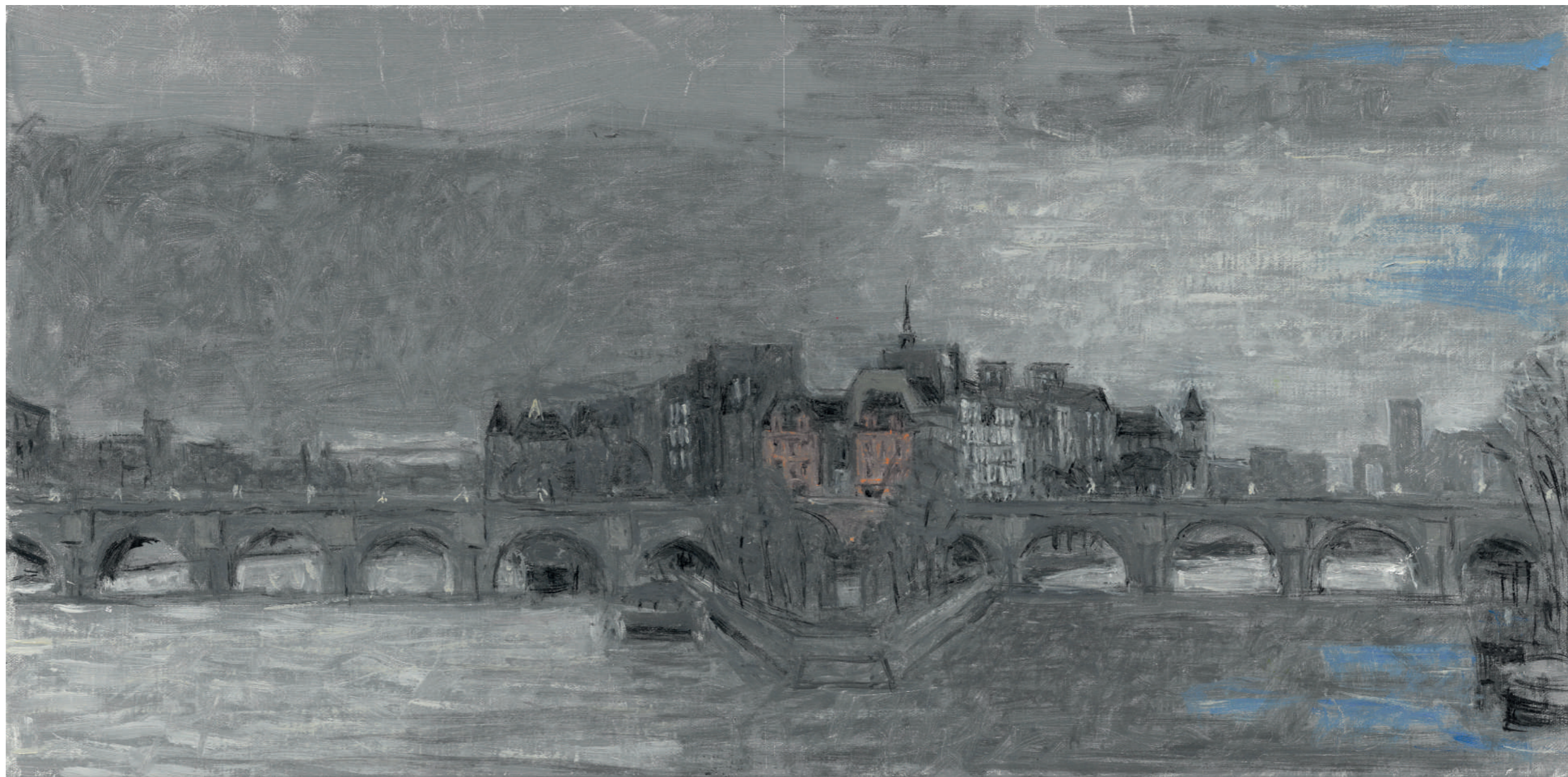
Le Vert-Galant III Huile sur toile, 25 x 50 cm, 2023.