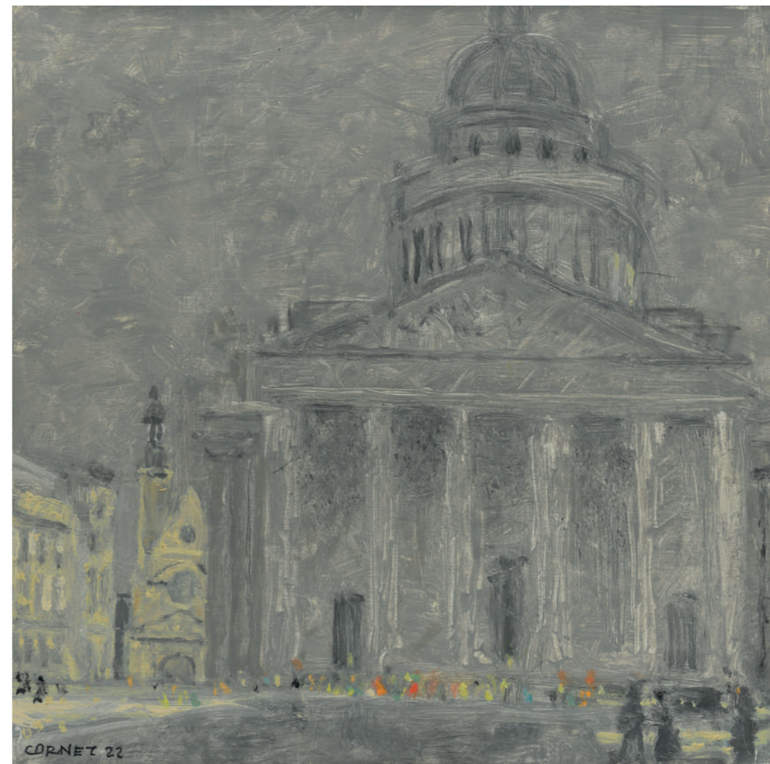
Le Panthéon Huile sur toile, 25 x 25 cm, 2022.