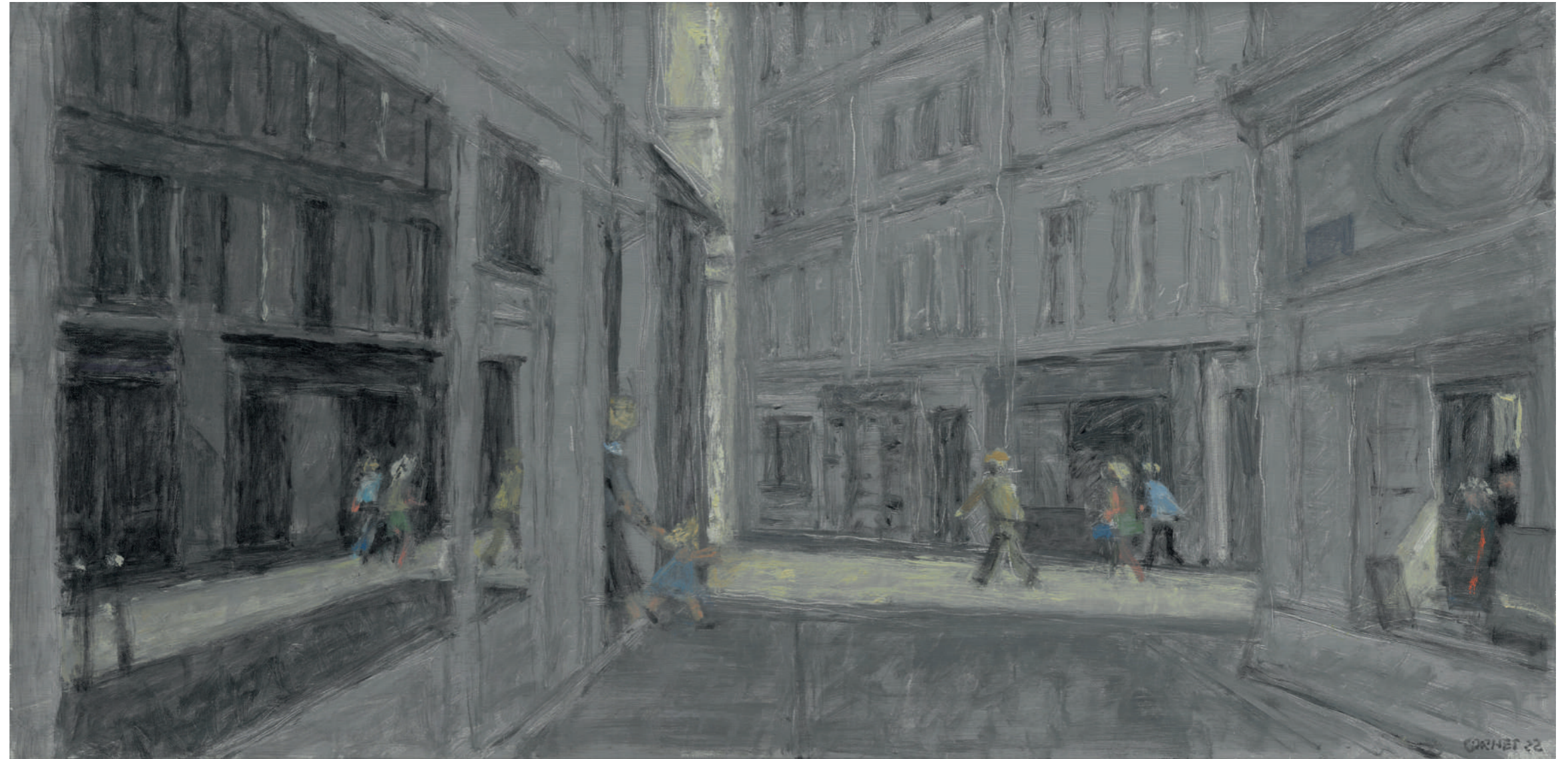
Rue de l'Échaudé (matin) Huile sur toile, 30 x 60 cm, 2022.