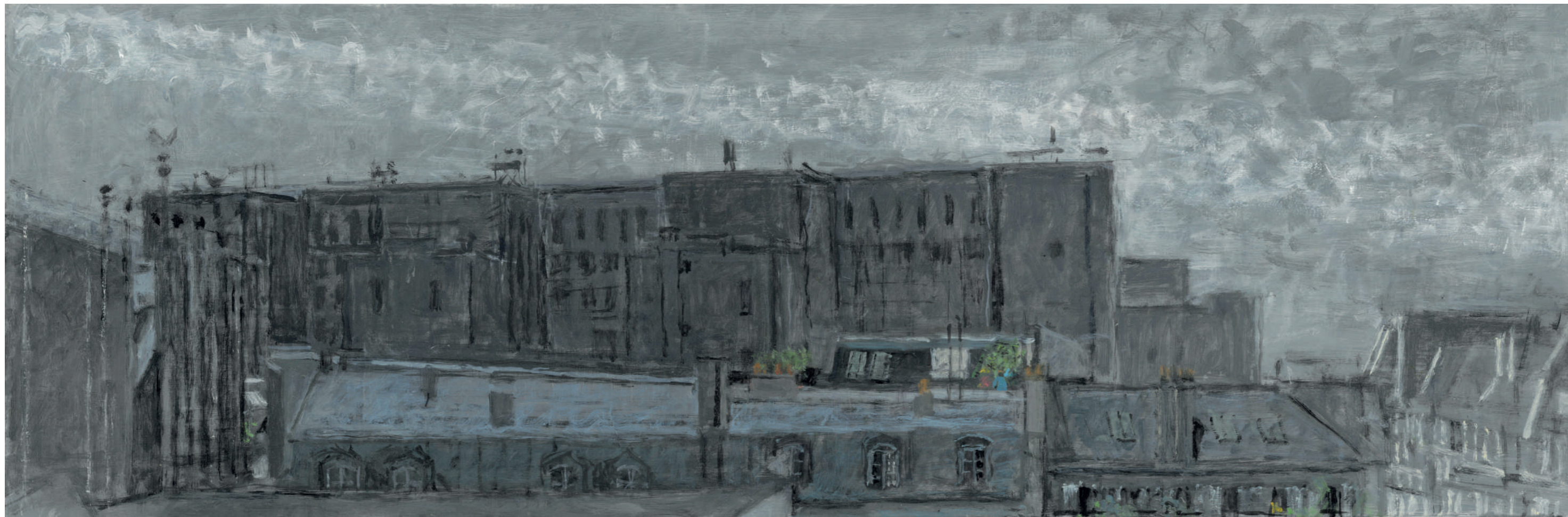
École de Médecine, la belle façade Huile sur toile, 30 x 90 cm, 2022.