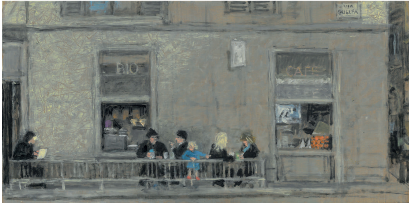
Florence, Via Guelfa Huile sur toile, 30 x 60 cm, 2022.