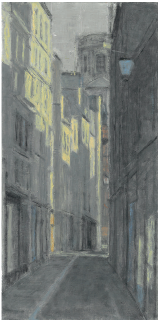
Rue de l'Échaudé, vers Saint-Sulpice Huile sur toile, 40 x 20 cm, 2022.