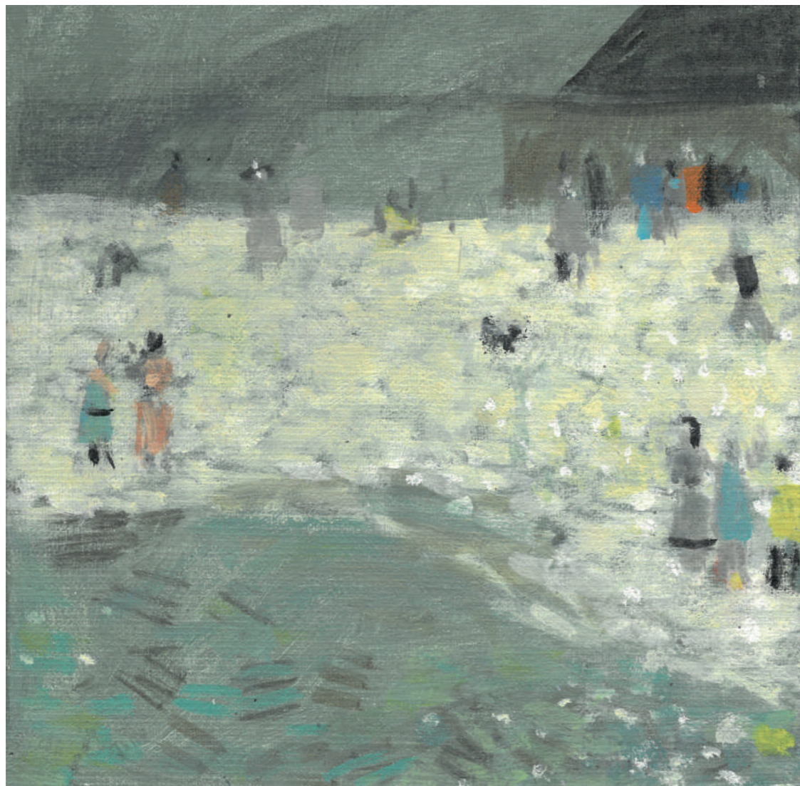
Port-en-Bessin I Huile sur toile, 20 x 20 cm, 2018.