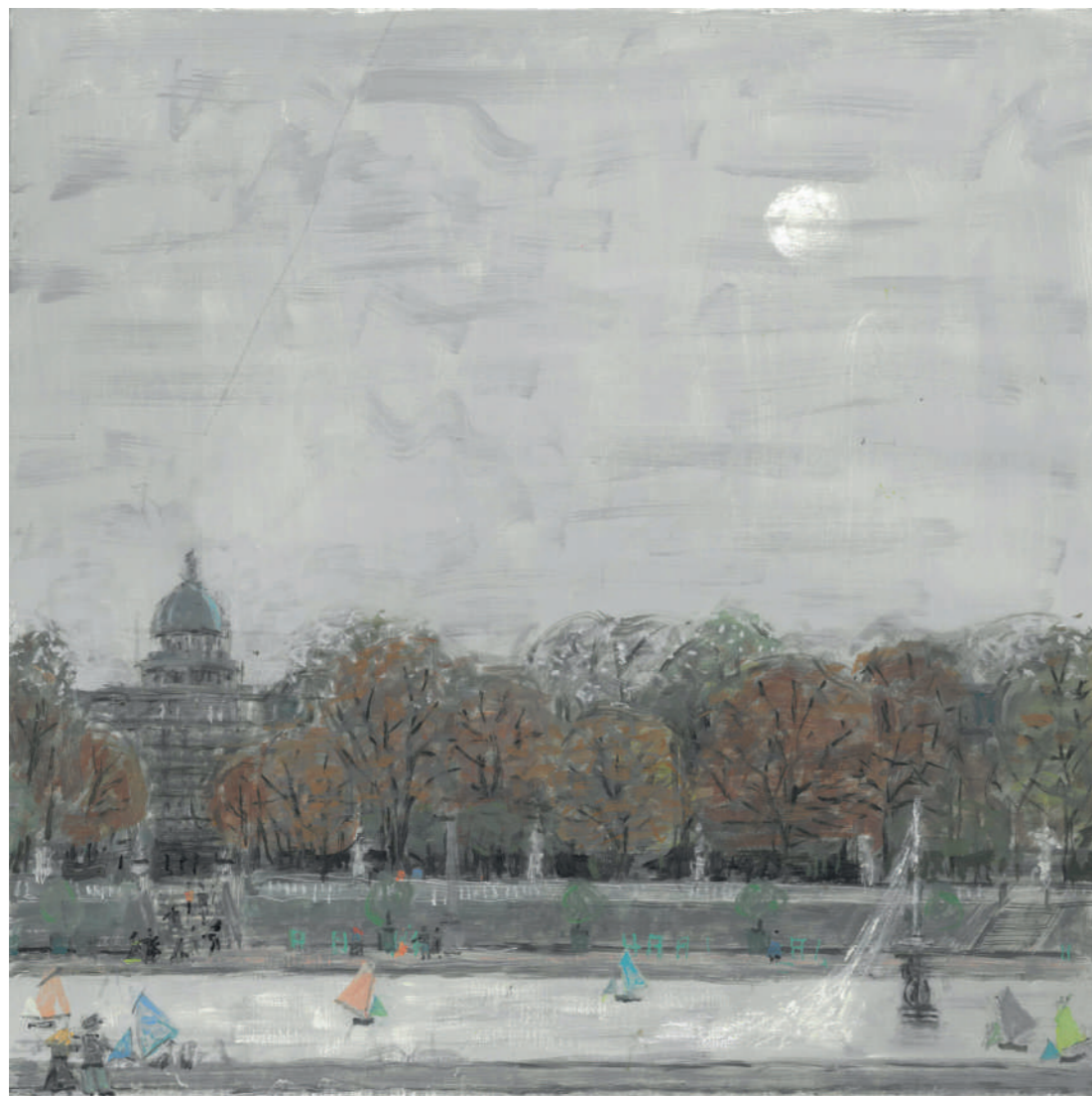
Le Bassin du Luxembourg (automne) Huile sur toile, 50 x 50 cm, 2022.