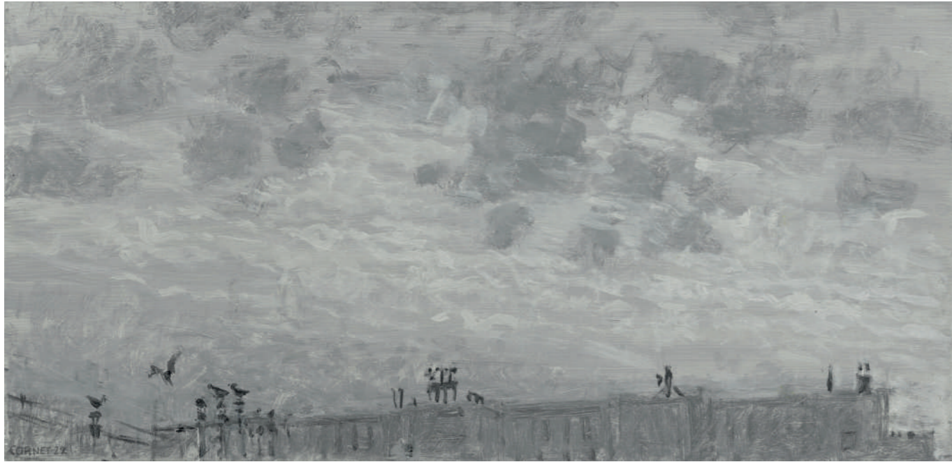
La vie des toits Huile sur toile, 25 x 50 cm, 2022.