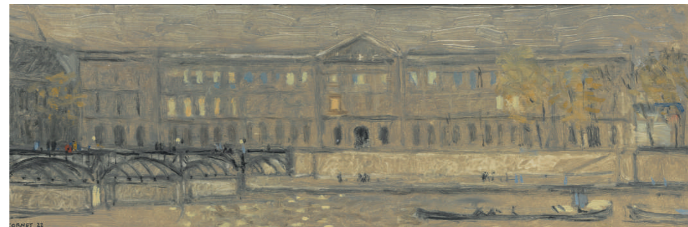
Le Louvre le soir Huile sur toile, 20 x 60 cm, 2022.