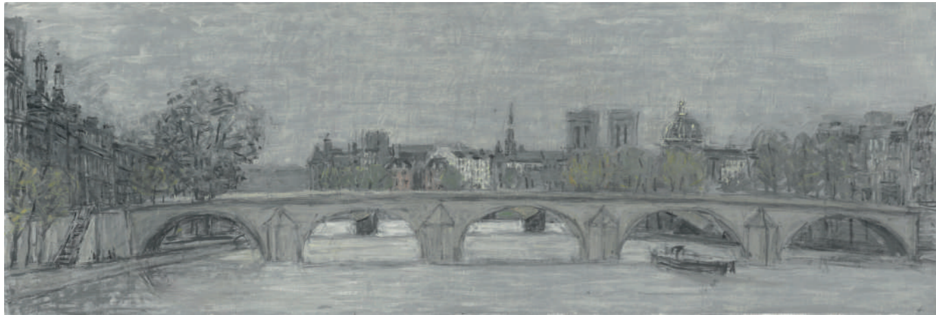
Le Pont Royal II Huile sur toile, 30 x 90 cm, 2023.