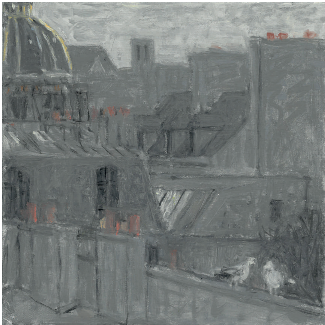
Conversation (brume du matin) Huile sur toile, 20 x 20 cm, 2023.