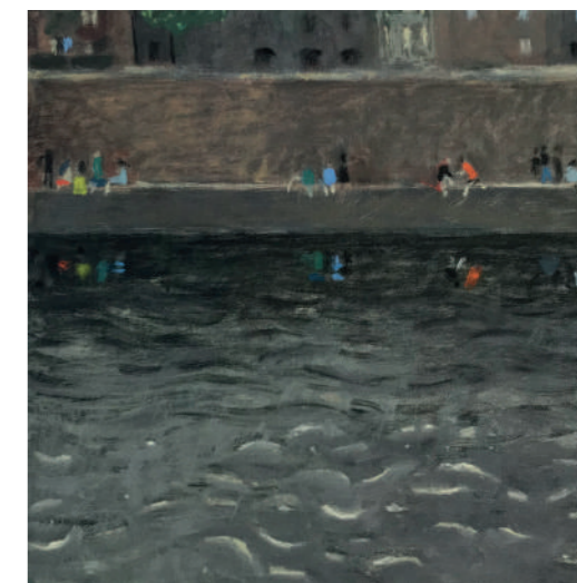
Ombre sur la Seine Huile sur toile, 25 x 25 cm, 2020.