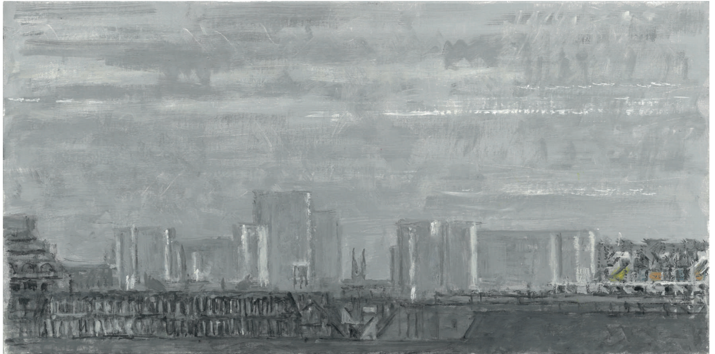
Saint Jean-Baptiste de Belleville Huile sur toile, 25 x 50 cm, 2023.