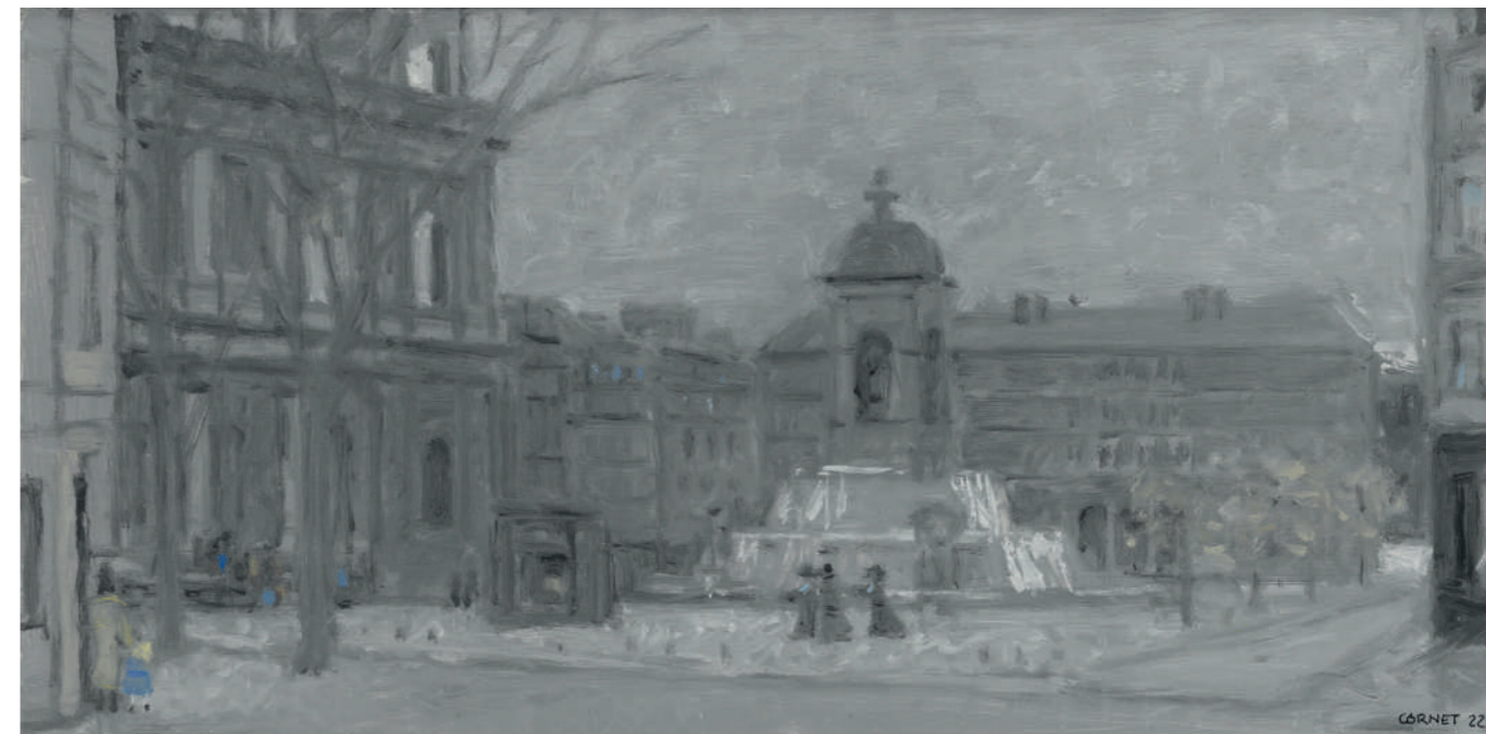
Place Saint-Sulpice II Huile sur toile, 25 x 50 cm, 2022.